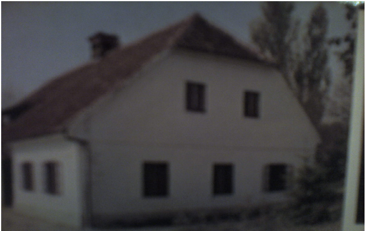
rodno mjesto Tita, očeva kuća u Kumrovcu