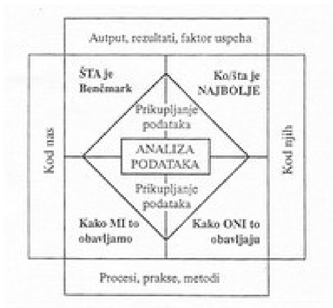
Slika 2. Šablon benčmarkinga

Implementacija dobijenih rezultata zavisi od spremnosti na promjene i prilagođavanje novom načinu rada.