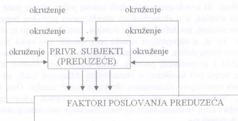
Slika 1. Uticaj faktora okruženja na poslovanje preduzeća

Faktorski uticaji ekonomskog ambijenta na privredne subjekte, prikazani su na sledećoj slici (slika 1.)