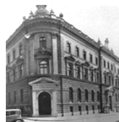
Slika 2. prvobitna zgrada