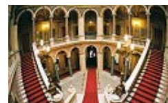
Slika 4. zgrada u Ulici kralja Petra