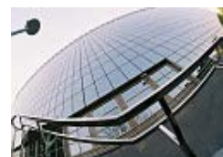
Slika 3. zgrada na Slaviji